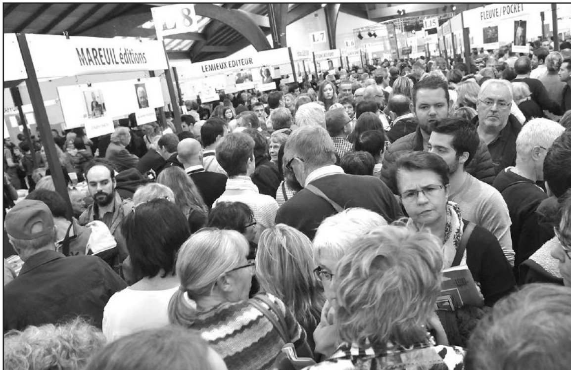
Plus de 50.000 personnes ont fréquenté la Foire pendant trois jours.