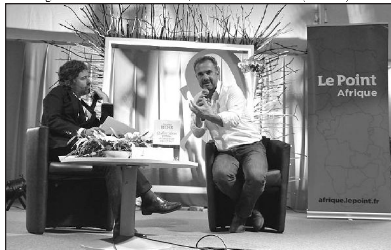
Abdennour Bidar défenseur de la fraternité universelle